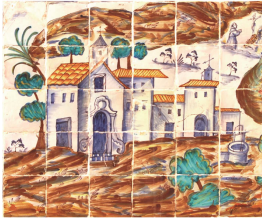
EATIM JESÚS POBRE JUNTA VEINAL